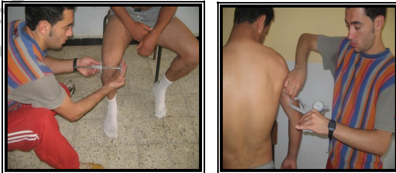
صورة رقم ١ : لبعض الأمثلة أثناء عملية القياس